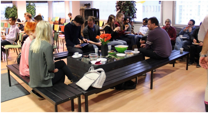
奥卢大学 Business Kitchen